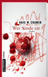
Wer Sünde sät 978-3-8392-1884-6 · 12,99 €