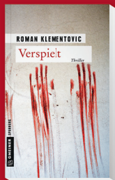
Verspielt 978-3-8392-1797-9 · 12,99 €