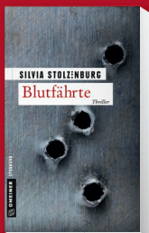
Blutfahrte 978-3-8392-2069-6 · 15,00 €