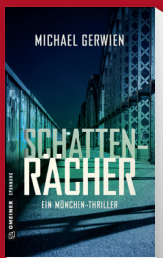
Schattenrächer 978-3-8392-2116-7 · 12,00 €