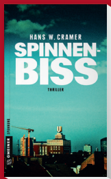
Spinnenbiss 978-3-8392-2106-8 · 13,00 €