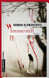
Immerstill 978-3-8392-1888-4 · 12,99 €